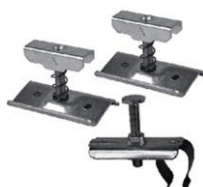
Support de tablette

NB : Les robinets et les thermostats doivent être retirés par vos soins avant notre prestation.